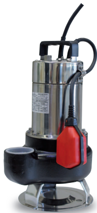
GXB 100 / 50 GXB 150 / 50 GXB 200 / 50